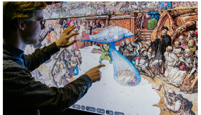
Centrica: TÜBKE TOUCH , 2021 Cloud basierte ArtCentrica Applikation

TÜBKE TOUCH ist eine von Centrica konzipierte Cloud Applikation der digitalen Bildungsvermittlung. Auf einem Touchscreen, Whiteboard oder Computerbildschirm kann man Tübkes Panoramagemälde im Ganzen betrachten und gezielt und detailgenau in das Werk hineinzoomen. Verschiedene Ansichtsoptionen, beispielsweise nach Themenkomplexen, sind zusätzlich mit weiterführenden Informationen hinterlegt. TÜBKE TOUCH ermöglicht die unmittelbare und intensive Auseinandersetzung mit einem Kunstwerk, das im Original bereits durch seine gewaltige Größe und dem Reichtum an Figuren kaum erfassbar ist.