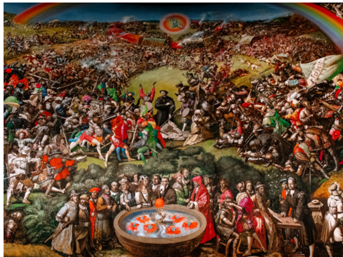
Werner Tübke: Frühbürgerliche Revolution in Deutschland, 1983/87 Öl auf Leinwand, 14 x 123 m, Installationansicht, Panorama Museum, Bad Frankenhausen

Aus den hochaufgelösten digitalen Bildern von Centrica wurde für die Räume des KUNSTKRAFTWERK eine multimediale und immersive Licht- und Klanginstallation in Form einer 27-minütigen Präsentation entwickelt. Unter Leitung des New Media Künstlers Franz Fischnaller und unter Mitwirkung eines Teams von Cineca , des führenden Hochleistungsrechen-