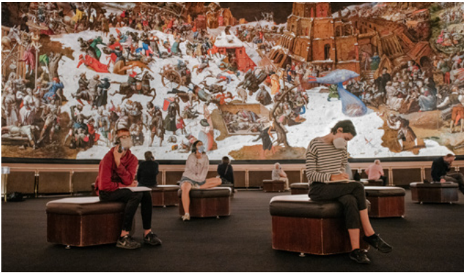
Werner Tübke: Frühbürgerliche Revolution in Deutschland , 1983/87 Öl auf Leinwand, 14 x 123 m, Installationansicht, Panorama Museum, Bad Frankenhausen

TÜBKE TOUCH ist eine von Centrica konzipierte Cloud Applikation der digitalen Bildungsvermittlung. Auf einem Touchscreen, Whiteboard oder Computerbildschirm kann man Tübkes Panoramagemälde im Ganzen betrachten und gezielt und detailgenau in das Werk hineinzoomen. Verschiedene Ansichtsoptionen, beispielsweise nach Themenkomplexen, sind zusätzlich mit weiterführenden Informationen hinterlegt. TÜBKE TOUCH ermöglicht die unmittelbare und intensive Auseinandersetzung mit einem Kunstwerk, das im Original bereits durch seine gewaltige Größe und dem Reichtum an Figuren kaum erfassbar ist.